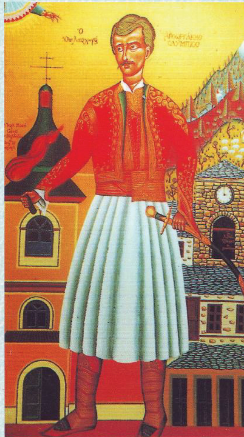
Γεωργιάκης Ολύμπιος (έργο του Ν. Γραϊκού)

ΕΚΔΟΣΗ ΤΗΣ ΦΙΛΕΚΠΑΙΔΕΥΤΙΚΗΣ ΑΔΕΛΦΟΤΗΤΑΣ ΛΙΒΑΔΙΩΤΩΝ ΗΠΑ «ΤΟ ΛΙΒΑΔΙ» ΚΑΙ ΤΗΣ ΕΦΗΜΕΡΙΔΑΣ "ΛΙΒΑΔΙ ΟΛΥΜΠΙΟΥ"