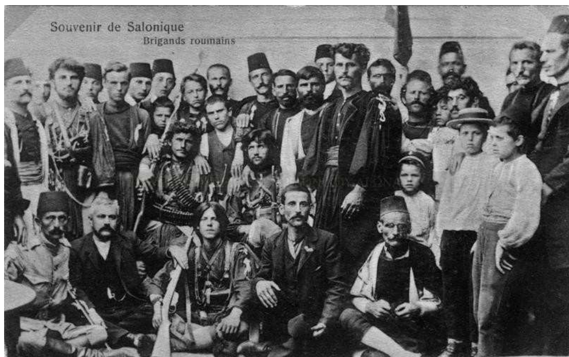
Εικόνα 5: Σώμα ρουμανιζόντων στη Θεσσαλονίκη κατά τη διάρκεια του Μακεδονικού Αγώνα.