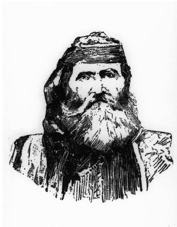
Εικόνα 7: Ο Περιβολιώτης και οπλαρχηγός της Εθνικής Εταιρείας Ζήσης Θεοδώρου (ψευδώνυμο Χρήστος Λεπενιώτης).