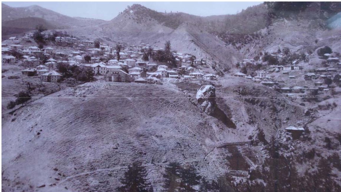
Εικόνα 2 : Το χωριό Περιβόλι Γρεβενών γύρω στα 1920