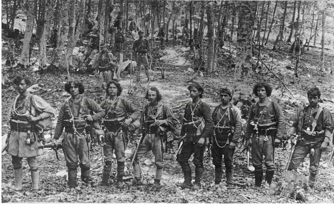
Εικόνα 6: Τσέτα ρουμανιζόντων το 1908 στη Βέροια.