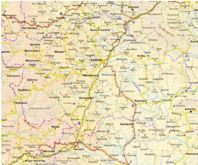
Εικόνα 1 : Χάρτης της περιοχής Γρεβενών.