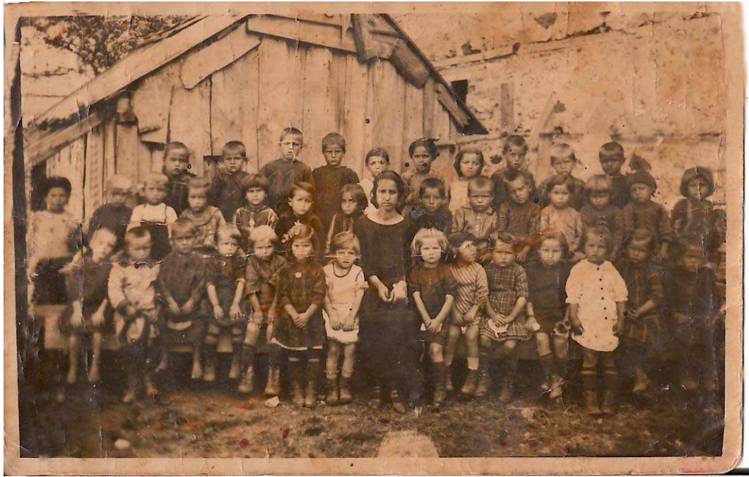
Εικόνα 10: Μαθητές και μαθήτριες στο ελληνικό σχολείο, που στεγαζόταν στην αυλή της εκκλησίας του Αγίου Γεωργίου. Περίπου 1920. (Αρχείο Αικατερίνης Σαράντη)