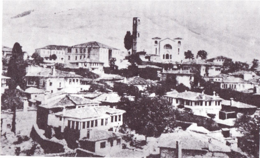
Εικόνα 1: Η Σιάτιστα, Κων/νος Α. Βακαλόπουλος, Ιστορία του Βόρειου Ελληνισμού, Μακεδονία, ό. π., σ. 97.

και οι φτωχότερες, επί πληρωμή, προς πώληση σε χωριά του κάμπου Καλαριών, Χρουπίστης κ. ά. 72