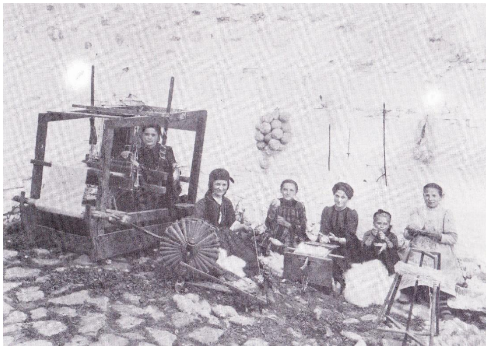
Εικόνα 5 : Σαμαρίνα, Γυναίκες που επεξεργάζονται το μαλλί, A.Wace-M. Thompson, Οι νομάδες των Βαλκανίων , ό. π., σ. 316.

πληροφορούμαστε ότι ο εμπορικός αυτός οίκος έστειλε στις 16 Απριλίου 1773 από τα Σκόπια 9 φορτώματα σαχτιάνια 166 και μεσίνια 167 αξίας 2.158 ασλανιών, καθώς και 6 φορτώματα σαχτιάνια από τα Βελεσά 168 (αξίας 4.331,85 ασλανιών). Σύμφωνα, επίσης, με τις σημειώσεις του Αθανασίου Κανατσούλη, ο εμπορικός αυτός οίκος, εκτός των άλλων, εμπορευόταν ακατέργαστα και κατεργασμένα δέρματα, που τα έστελνε στα Σκόπια. 169