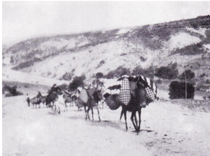
Εικόνα 2: Οικογένειες Βλάχων στο δρόμο, A. Wace - M. Thompson, Οι Νομάδες στα Βαλκάνια , ό. π., σ. 306.

τους γέμιζε με χαρά και τους έκανε να ξεχνούν τις ταλαιπωρίες τους, δίνοντάς τους τη δύναμη να συνεχίζουν να ελπίζουν για ένα καλύτερο αύριο. Πολλές νομάδες οικογένειες της Βόρειας Πίνδου που ξεχείμαζαν στον κάμπο της Θεσσαλίας ή της Νότιας Μακεδονίας, κανόνιζαν την ημερομηνία της αναχώρησής τους για τα ορεινά κάθε άνοιξη, έτσι ώστε να έφευγαν μαζί, συντροφεύοντας η μία την άλλη κατά τη διαδρομή. 97