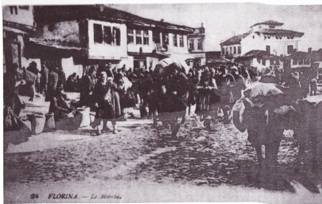
Εικόνα 6: Φλώρινα (1914) Η αγορά, όπου η σημερινή πλατεία Ρούσβελτ (Αρχείο Αθ. Βογιατζή). Πηγή: Απ. Βακαλόπουλος, Ιστορία του νέου Ελληνισμού, Μακεδονία, ό. π. , σ. 379.

Η αγορά της Βλάστης, ή οποία βρισκόταν στο κέντρο της κομόπολης ήταν αρκετά ευρύχωρη και λιθόστρωτη. Δύο φορές την εβδομάδα, τη Δευτέρα και την Πέμπτη, οργανωνόταν η αγορά στην οποία έρχονταν πολλοί για να πουλήσουν τα προϊόντα τους. Οι Κονιάροι, Τούρκοι του κάμπου των Καϊλαριών, έφερναν συνήθως δημητριακά, φρούτα και κτηνοτροφικά προϊόντα. Την Τετάρτη γινόταν η αγορά στα Καϊλάρια και την Παρασκευή στο Τσοτύλι. Τα πολλά μαγαζιά βρίσκονταν στην κάτω συνοικία, τα Κατ' Καλιάρια, όπου έφθαναν οι Βλατσιώτες για να πουλήσουν πανιά, κάπες, ταλαγάνια, βελέντζες, τέντες, τσιράπια, είδη υφαντικής και χειροτεχνίας περισσότερο ενώ τυροκομικά οι κτηνοτρόφοι. 211