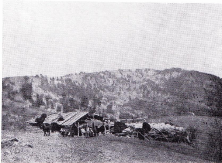
Εικόνα 4: Σαμαρίνα, το άρμεγμα σε ένα μαντρί, A.Wace-M.Thompson, Οι Νομάδες των Βαλκανίων , ό. π., σ. 315

Ο καταμερισμός της εργασίας στα τσελιγκάτα δεν περιοριζόταν μόνο στη φύλαξη και στην περιποίηση των κοπαδιών αλλά υπήρχαν και οι λεγόμενοι αρμεχτάρηδες ή αρμεγάρηδες . Οι παραπάνω όφειλαν να είναι γρήγοροι και να τραβούν όλο το γάλα από την κάθε προβατίνα και να μην πληγώνουν με τα νύχια τους μαστούς των προβάτων. 122 Όσο οι προβατίνες και οι γίδες θήλαζαν τα μικρά τους δεν αρμέγονταν, παρά σε εντελώς εξαιρετικές περιπτώσεις. Ο αποθηλασμός γινόταν τον Γενάρη, περίοδο έναρξης του αρμέγματος. 123 Το άρμεγα των αιγοπροβάτων γινόταν δύο φορές την ημέρα: μία φορά στις 7 περίπου το απόγευμα, όταν τα κοπάδια έφθαναν στη στάνη, κι άλλη μία νωρίς τα ξημερώματα, περίπου στις 4 με 5 προτού αναχωρήσουν για την πρωινή βοσκή. Στην εργασία του αρμέγματος βοηθούσαν όλοι, από τα μικρά παιδιά μέχρι τους ηλικιωμένους. Οι Βλάχοι έκοβαν κλαριά και τα τοποθετούσαν σε σειρά, φτιάχνοντας τη ρούγα , μία πορτίτσα μέσα από την οποία περνούσαν τα πρόβατα