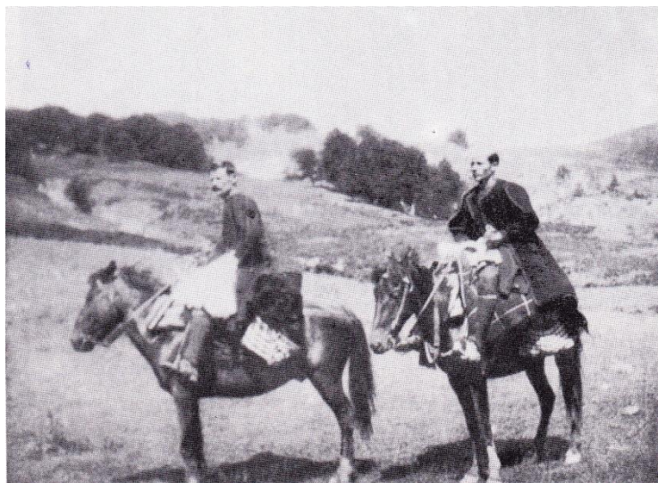
Εικόνα 3: Αγωγιάτες Βλάχοι, A.Wace-M.Thompson, Οι Νομάδες στα Βαλκάνια , ό. π., σ. 306.

την άνοιξη, ή να κατασκευάζαν διάφορα αντικείμενα πού τα πουλούσαν στα πανηγύρια. 100