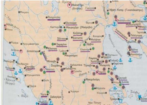
Χάρτης 2 : Τα σημαντικότερα διοικητικά και οικονομικά κέντρα της Δυτικής Μακεδονίας τον 18 ο αιώνα.