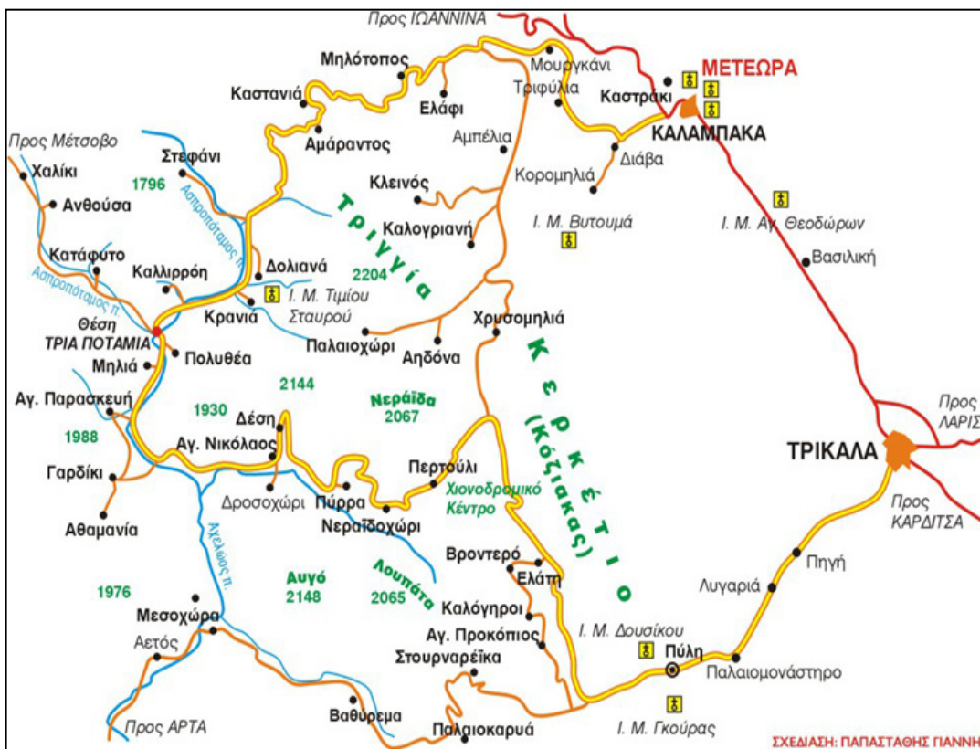
Εικόνα 4 . Χάρτης χωριών Ασπροποτάμου, Καμναϊτικού ποταμού και Καλαμπάκας

Πιο ανατολικά, είναι η περιοχή της ορεινής Καλαμπάκας, όπου συναντάμε και άλλα βλαχοχώρια. Τα χωριά αυτά ανήκουν στον σημερινό δήμο Καλαμπάκας. Για την εύκολη κατανόηση θα τα ορίσουμε στην παρούσα εργασία ως «Τα χωριά γύρω απ' την Τριγγιά». Το όρος Τριγγιά είναι ορεινό συγκρότημα της νότιας Πίνδου στο δυτικό τμήμα του Νομού Τρικάλων. Το όνομά της το έχει λάβει από την ομώνυμη υψηλότερη κορυφή της (2.204 μέτρα). Τα χωριά λοιπόν αυτής της ενότητας είναι η Καστανιά (Κουστιάνα), ο Αμάραντος (Βιντίστα) με τους οικισμούς Μυλότοπο (Φάρμα) και Ελάφι (Λουζέστη), η Καλομοίρα (Γκουντοβάζντα), ο Κλεινός (Κλίνοβο) με τους οικισμούς Αμπέλια και Χρυσίνα, η Καλογριανή, η Γλυκομηλιά (Κάτω Περλιάγκο), η Χρυσομηλιά (Άνω Περγλιάγκο) και η Αηδόνα (Αϊβάν).