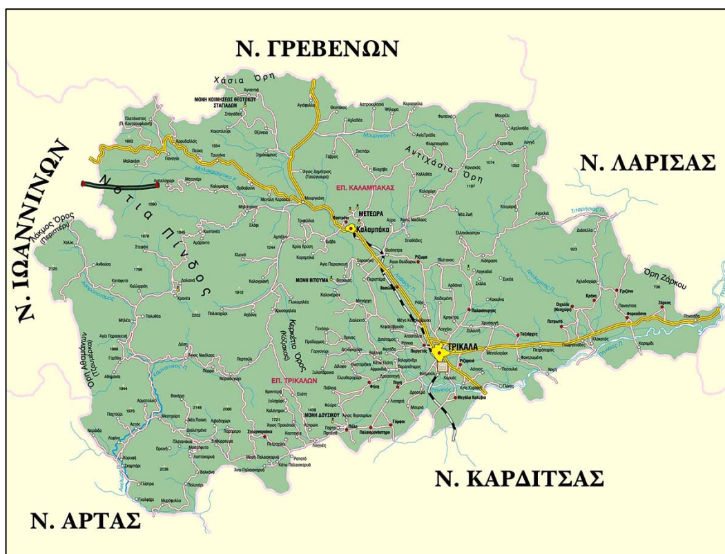
Εικόνα 1. Χάρτης νομού Τρικάλων

Γεωγραφικά η Θεσσαλία αποτελείται από τους νομούς Λάρισας, Τρικάλων, Καρδίτσας και Βόλου. Η περιοχή στην οποία εστιάζει κυρίως η έρευνα είναι ο Ασπροπόταμος του νομού Τρικάλων, αλλά και περιοχές του ορεινού δικτύου της νοτίου Πίνδου και κάποιες περιοχές του κάμπου.