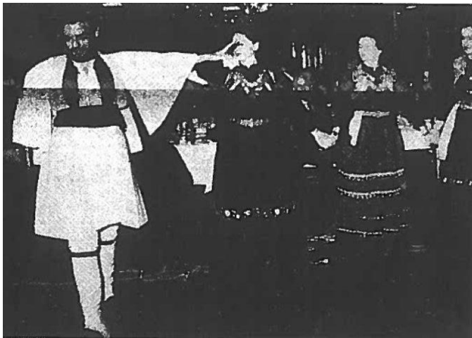
Εικόνα 10. Στιγμιότυπο κατά τη χοροεσπερίδα του Συνδέσμου Σαμαριναίων Αθηνών του αποκριάτικου χορού. (αρ. φυλ. 59, σελίδα 3, Μάρτιος 1975)

«Η μεγάλη προσέλευση των μελών και φίλων της Σαμαρίνας. Οι προσαχθέντες έφτασαν περίπου τους 400... Η άριστη καθ' όλα εμφάνιση του χορευτικού ομίλου, αποτελουμένου εκ νέων Σαμαρινιωτών...θα μας χορέψουν βλάχικους χορούς ντυμένοι με τις ενδυμασίες του τόπου μας...», «Στη συνέχεια οι πρεσβύτεροι Σαμαριναίοι άνοιξαν το χορό με το "Παιδιά απ' τη Σαμαρίνα"». 146