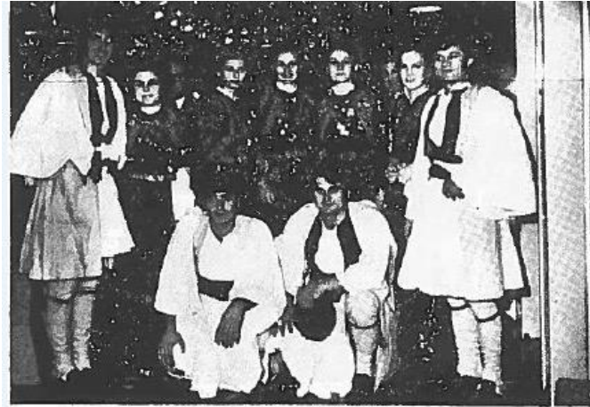
Εικόνα 9. Ο χορευτικός όμιλος του συνδέσμου Σαμαριναίων Αθηνών.(αρ.φυλ.46, σελίδα 2, Φεβρουάριος 1974).

«Καταπληκτική επιτυχία εσημείωσε ο εφετεινός αποκριάτικος χορός του συνδέσμου Σαμαριναίων Αθηνών "Ο Σμόλικας"...», «Η μεγαλύτερη έκπληξη στη χοροεσπερίδα αυτή ήταν η παρουσία του χορευτικού ομίλου. Πέντε νεαρές Σαμαρινιωτοπούλες και τέσσερις νέοι άνδρες, ντυμένοι με την πατροπαράδοτη Σαμαρινιώτικη στολή, χόρεψαν τους τοπικούς χορούς αρχίζοντας με το τραγούδι "Παιδιά της Σαμαρίνας", τελειώνοντας με το συγκαθιστό και το Γιάννινα-Γιαννάκινα». 143