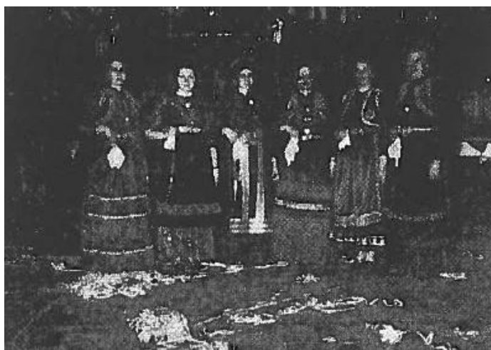
Εικόνα 12. Γυναικείος όμιλος του συνδέσμου Σαμαριναίων Αθηνών από τον αποκριάτικο ετήσιο χορό. (αρ. φυλ.105-106, σελ 4, Ιανουάριος-Φεβρουάριος 1979).

«...στους λίγους ευρωπαϊκούς χορούς που χορεύτηκαν (ένα κλασικό ταγκό και ένα βιεννέζικο βαλς)...». 152