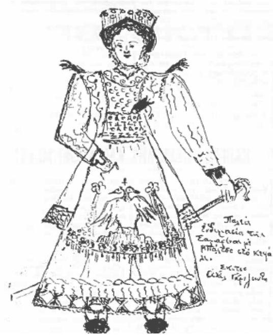
Εικόνα 8. Παλιά ενδυμασία της Σαμαρίνας με «Μπάλτσο» στο κεφάλι, όπως δίνεται σε άρθρο της εφημερίδας. (στίτσο του Αχιλλέα Γκριζιώτη, Οκτώβριος 1976).