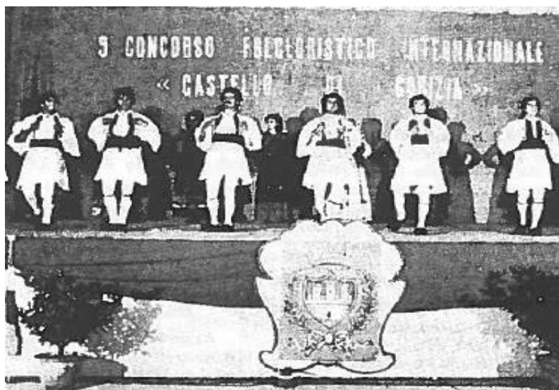
Εικόνα 14. Το χορευτικό συγκρότημα "Οι Σαμαριναίοι" που έλαβαν το πρώτο χρυσό βραβείο στο διεθνή διαγωνισμό στη Γκορίτσια της Β. Ιταλίας.(αρ. φυλ.113-114, σελ 1, Σεπτέμβριος-Οκτώβριος 1979)

γάμου στη Σαμαρίνα, "Όλη τη νύχτα περπατώ". Ακολούθησε αναπαράσταση προετοιμασίας του γάμου...με την συνοδεία της βμελούς ορχήστρας δημοτικής μουσικής του Μηνά. Ακολούθως οι χορευτές και χορεύτριες μας παρουσίασαν τρεις χορούς της όμορφης Σαμαρίνας το "Αρχοντόπουλο", Καραμπάτικός" και το "Λαφίνα" εν μέσω ενθουσιωδών χειροκροτημάτων του κοινού...», «...απένειμε το χρυσό μετάλλιο και βαρύτιμο κύπελλο του Πρώτου βραβείου στο συγκρότημα της δεκαετίας όπως χαρακτηρίστηκε δηλ. τους Σαμαριναίους και το χρηματικό έπαθλο...». 169