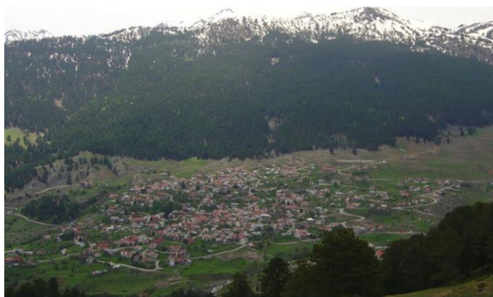
Εικόνα 1. Πανοραμική άποψη της Σαμαρίνας.

Βρίσκεται χτισμένη ανάμεσα από πυκνά δάση πεύκου, οξιάς, πυξαριού και ρόμπολου. Έχει άφθονα κρύα νερά, ασύγκριτες φυσικές καλλονές και κλίμα πολύ υγιεινό. Για αυτά της τα προσόντα την είπαν και τη βάφτισαν «Ωραία Σαμαρίνα». Η Σαμαρίνα χαρακτηρίζεται από τη ζωντάνια και την έντονη δραστηριότητα των κατοίκων της σε πολλούς τομείς 2 . Οι Σαμαριναίοι με πολυσχιδή παρουσία στη σύγχρονη ελληνική ζωή και πραγματικότητα, διατηρούν τη Σαμαρίνα ως αντίληψη ζωής στον τόπο διαβίωσης τους, αλλά και συντηρούν στις πλαγιές του Σμόλικα τις πατρογονικές εστίες και παραδόσεις τους. Έτσι η Σαμαρίνα παρουσιάζει συνεχώς μια δυναμική πολυεπίπεδη εξέλιξη στο χώρο και στο χρόνο.