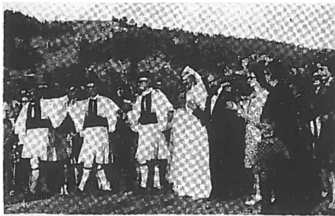
Εικόνα 7. Στιγμιότυπο από την αναβίωση του γάμου της Σαμαρίνας. Νύφη και γαμπρός στο μεγάλο χορό των γερόντων. (αρ. φυλ. 63, σελίδα 3, Ιούλιος 1975)

Επίσης η αναβίωση των εθίμων του γάμου έχει εξέχουσα θέση και στις διάφορες μουσικοχορευτικές εκδηλώσεις των συνδέσμων των Σαμαριναίων. Χαρακτηριστικά σε άρθρο, «Χορευτικές εκδηλώσεις του συνδέσμου Σαμαριναίων Λαρίσης εις τα Τρίκαλα», αναφέρεται: