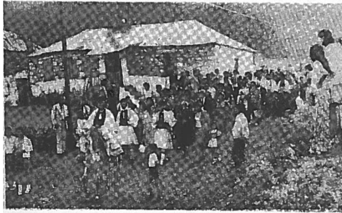
Εικόνα 6. Στιγμιότυπο από την αναβίωση του γάμου της Σαμαρίνας. Καβάλα στο άλογο πηγαίνει ο νουνός στο γάμο. (αρ. φυλ. 63, σελίδα 3, Ιούλιος 1975)