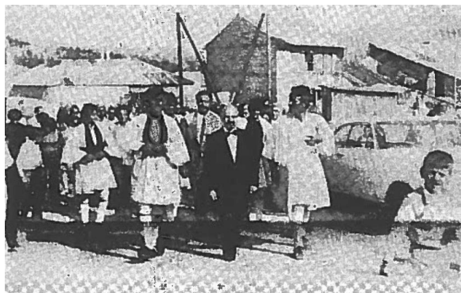
Εικόνα 5. Στιγμιότυπο από την αναβίωση του γάμου της Σαμαρίνας. Οι μπράτιμοι και ο νονός πηγαίνουν το γαμπρό στην εκκλησία. (αρ. φυλ. 63, σελίδα 3, Ιούλιος 1975)