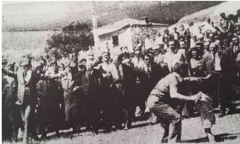
Εικόνα 3. Στιγμιότυπο από το χορό Τσιάτσιο όπου ο γηραιότερος του χωριού σέρνει το χορό. (αρ. φυλ.64-65, Αύγουστος-Σεπτέμβριος 1975)