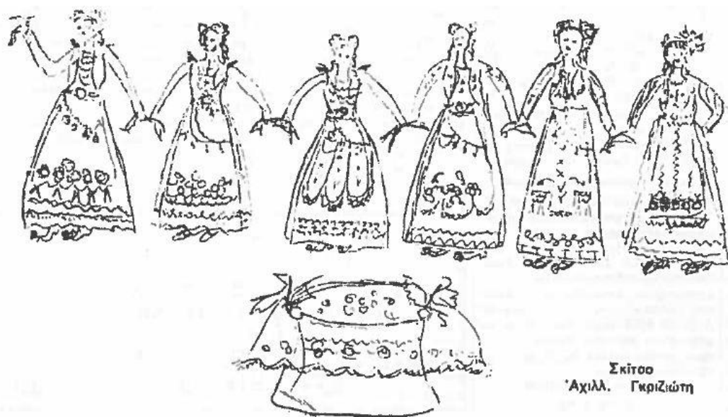
Εικόνα 4. Παραδοσιακή φορεσιά των γυναικών κατά το έθιμο του Κλήδονα στην περιοχή της Σαμαρίνας. (σκίτσο του Αχιλλέα Γκριζιώτη, έτος 1974).

«Και η πομπή τραβά προς το μέρος που ξεκίνησε. Στην μεγάλη αυλή ήταν αναμμένοι φανοί από δαδιά και μια φωτιά από μυρωδάτα ξύλα κέδρου. Η πομπή απόθεσε το δοχείο κάτω και τα κορίτσια στήνουν τρίδιπλο χορό με τραγούδια. Πρώτη έσυρε το χορό...η νεόνυμφη. Φορούσε βαριά αμφίεση βλάχικη με εννέα σειρές γκριουρντάνι από πεντόλιρα...», «Στη συνέχεια χόρευαν όλα τα κορίτσια και γύρω οι μάνες και οι συγγενείς τα καμάρωναν και τα νυφοδιάλεγαν». 116