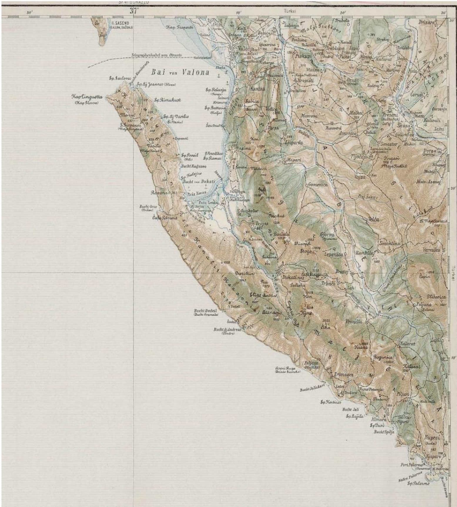
Αυστριακός χάρτης του τμήματος Αυλώνας

Χάρτης των εκκλησιών και σχολείων του σαντζακίου Βερατίου. Με κόκκινο σταυρό συμβολίζονται οι εκκλησίες ενώ με κύκλο τα σχολεία.