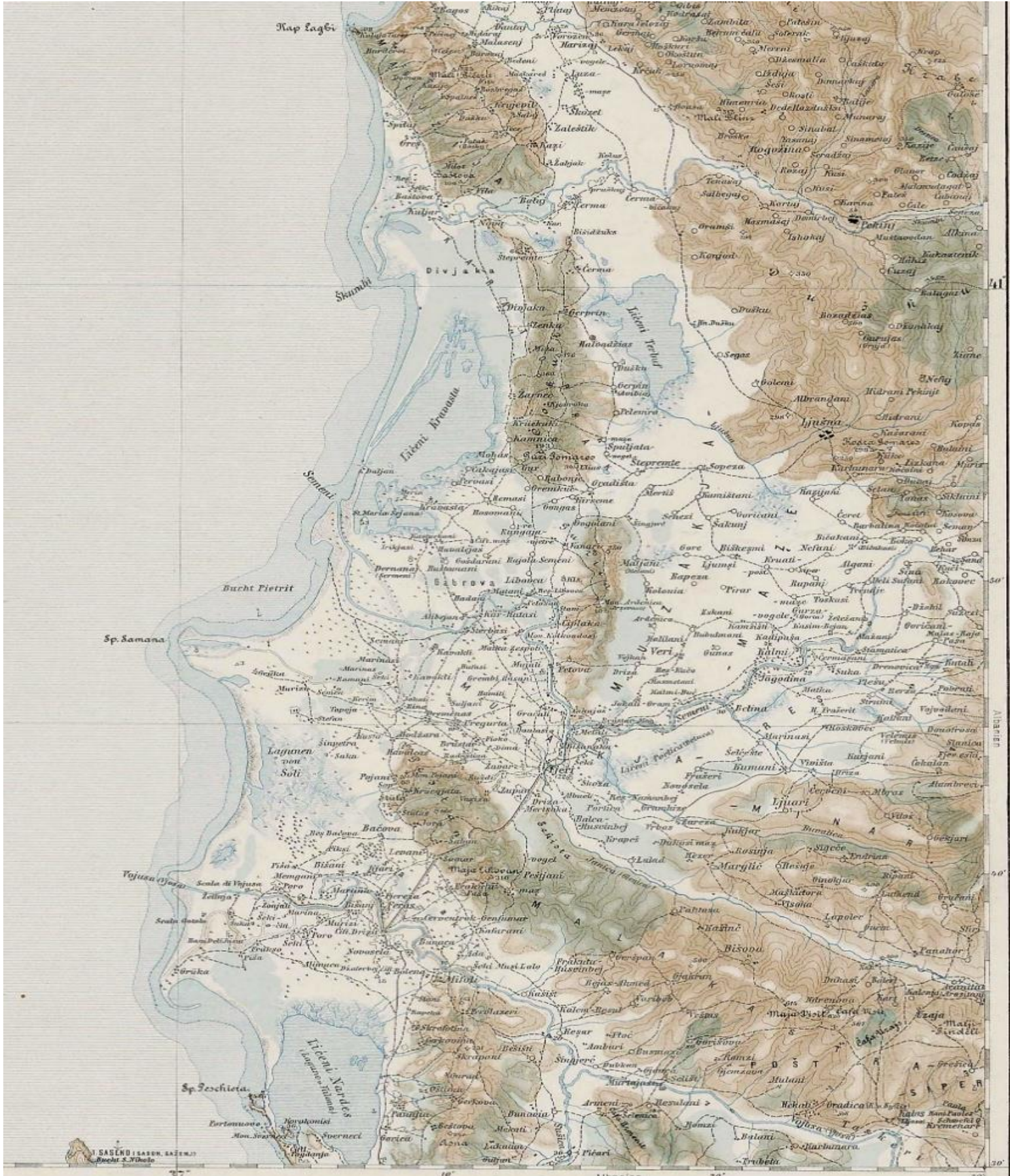
Αυστριακός χάρτης του βόρειου τμήματος (Μικρή και Μεγάλη Μουζακιά)