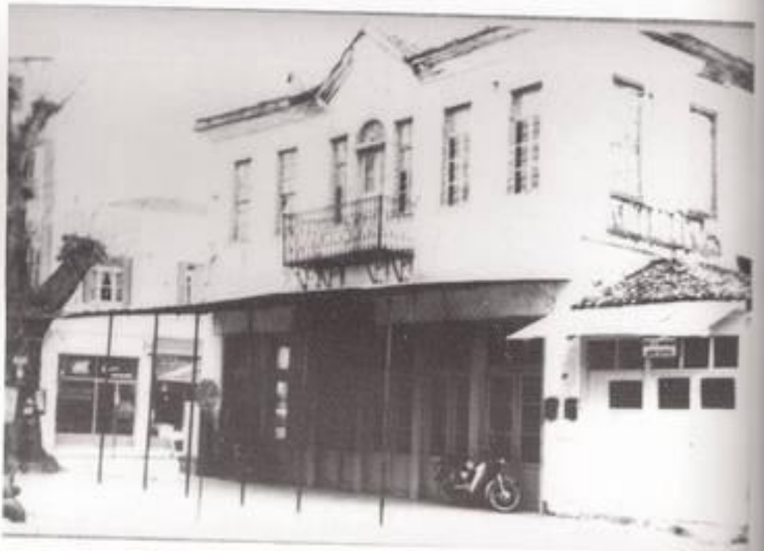
Εικόνα 7. (πάνω φωτογραφία) Το χάνι Δεβελέγκα - (κάτω φωτογραφία) Το καφε- νείο ΒΥΖΑΝΤΙΟ του Μήτσου Παπαργύρη.