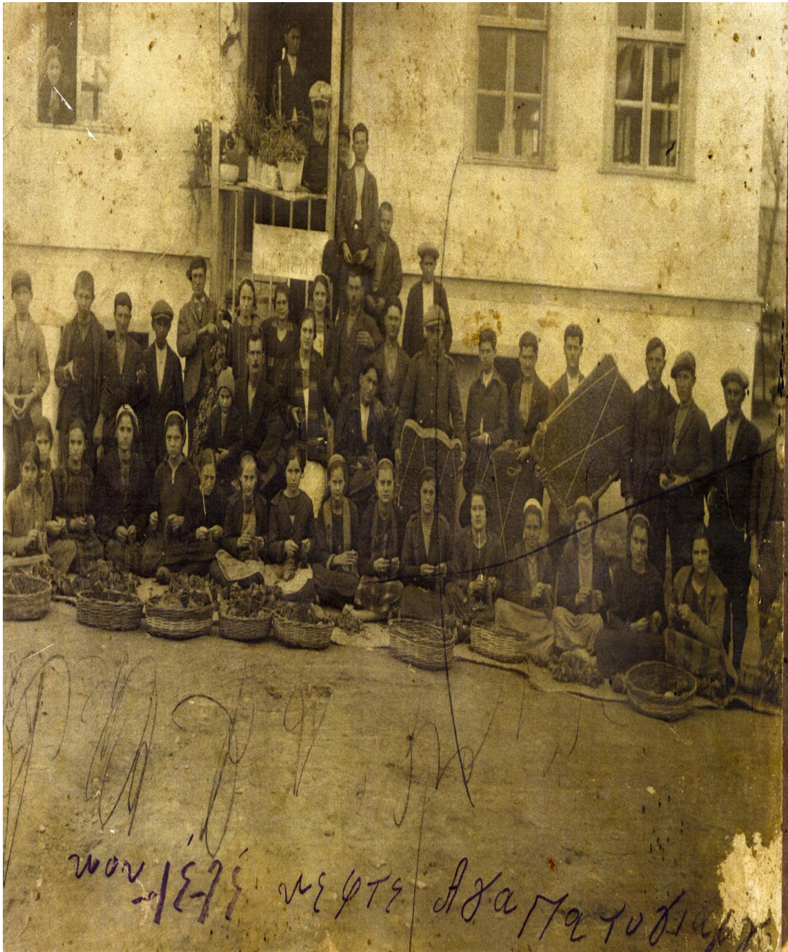
Εικόνα 1. Επεξεργασία καπνού (παστάλιασμα) στο χωριό Γραβούνα.