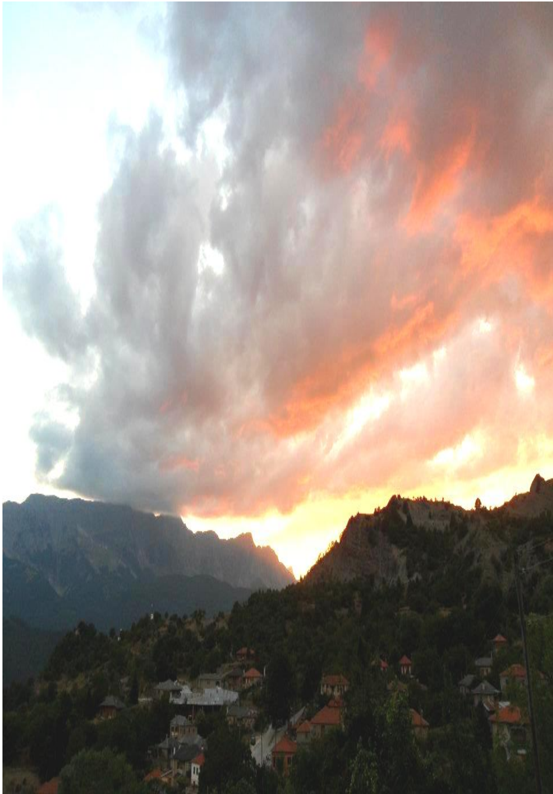
Εικόνα 3. Λάιστα Ζαγορίου.