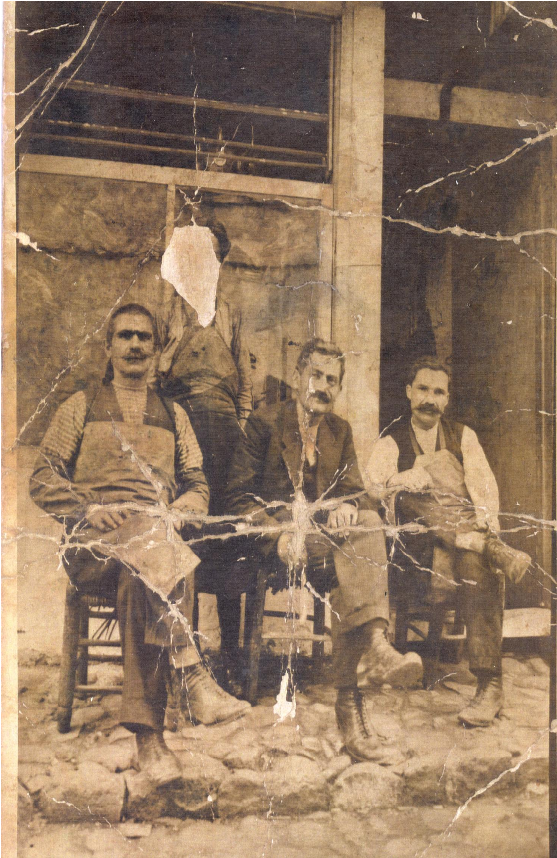
Εικόνα 6. Επαγγελματίες της Χρυσούπολης, έξω από τα καταστήματα τους.